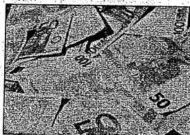
La scarsa liquidità preoccupa